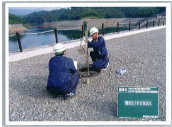
レベルによる、基準高確認状況