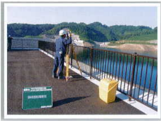
光波測距機による、堤体表面変位の観測状況

現在、当土地改良区では、九州農政局都城盆地農業水利事業所より「平成20年度 都城盆地農業水利事業 木之川内ダム試験湛水（情報収集・堤体表面変位観測）業務」を受託し取り組んでいます。この業務は、水を貯めることによってダムの堤体に変位がないかを調査する観測業務と、木之川内ダム及び田野頭首工(都城市吉之元町)下流域にお住まいの方々から河川流況に対する意見や要望等を聞き取り調査する情報収集業務との二つに大別され、観測業務は原則として週1回のペースで行っています。情報収集業務については調査範囲が広範囲にわたるため、是非とも皆様のご協力をお願いいたします。ダム及び頭首工の運用に際してお気付きの点がございましたら、些細なことでも構いませんので当土地改良区までご連絡ください。お待ちしております。