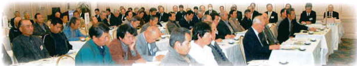
第1回総代会のようす