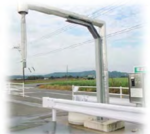
コイン式 給水スタンド

※コインの販売は当土地改良区事務所で行っています。 鍵式の給水スタンドをご利用されたい方は土地改良区までご連絡下さい。