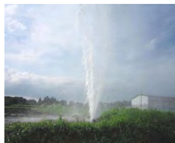
トラクターによる給水栓破損