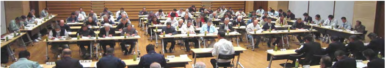
第5回通常総代会の様子