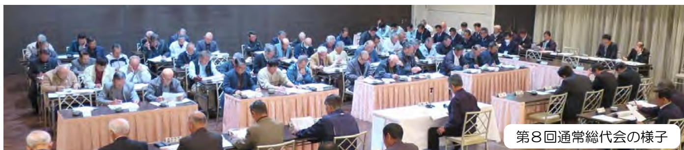
第8回通常総代会の様子