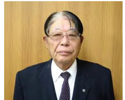
都城盆地土地改良区

組合員の皆様の今後なお一層のご理解とご協力をお願い申し上げます理事長の挨拶と致します。