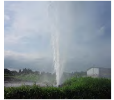
トラクターによる給水栓破損