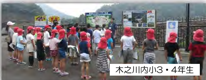
木之川内小3・4年生