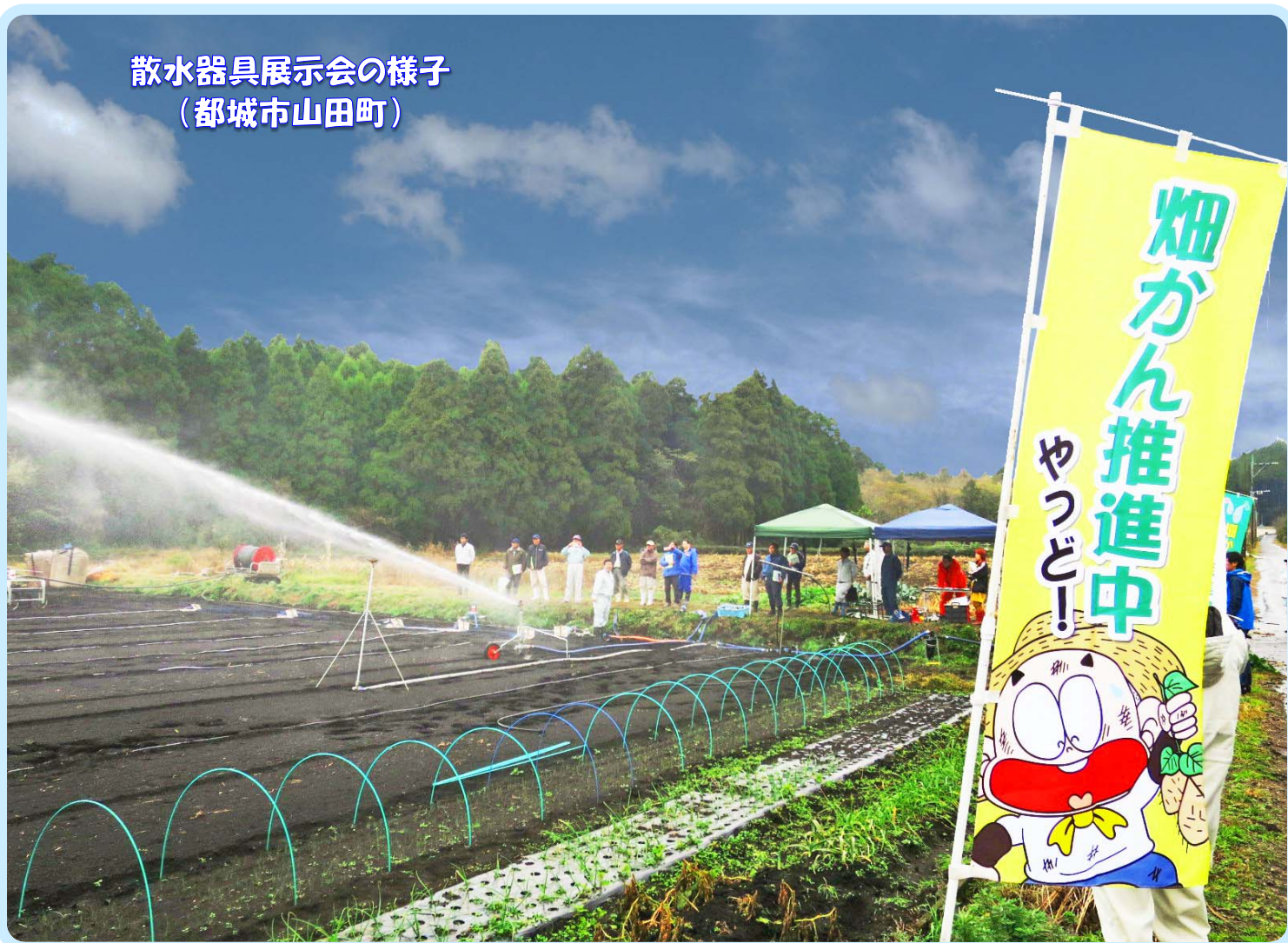
散水器具展示会の様子 (都城市山田町)